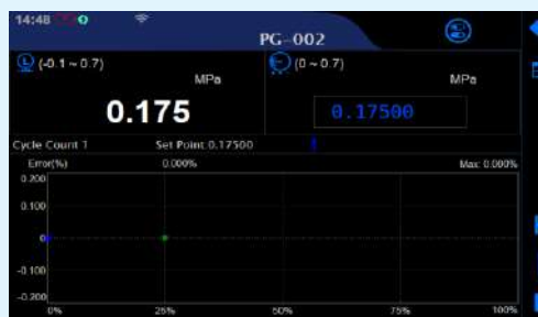
Калибровка Манометр / Преобразователь / реле