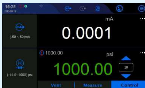
Автоматическая калибровка высокого давления